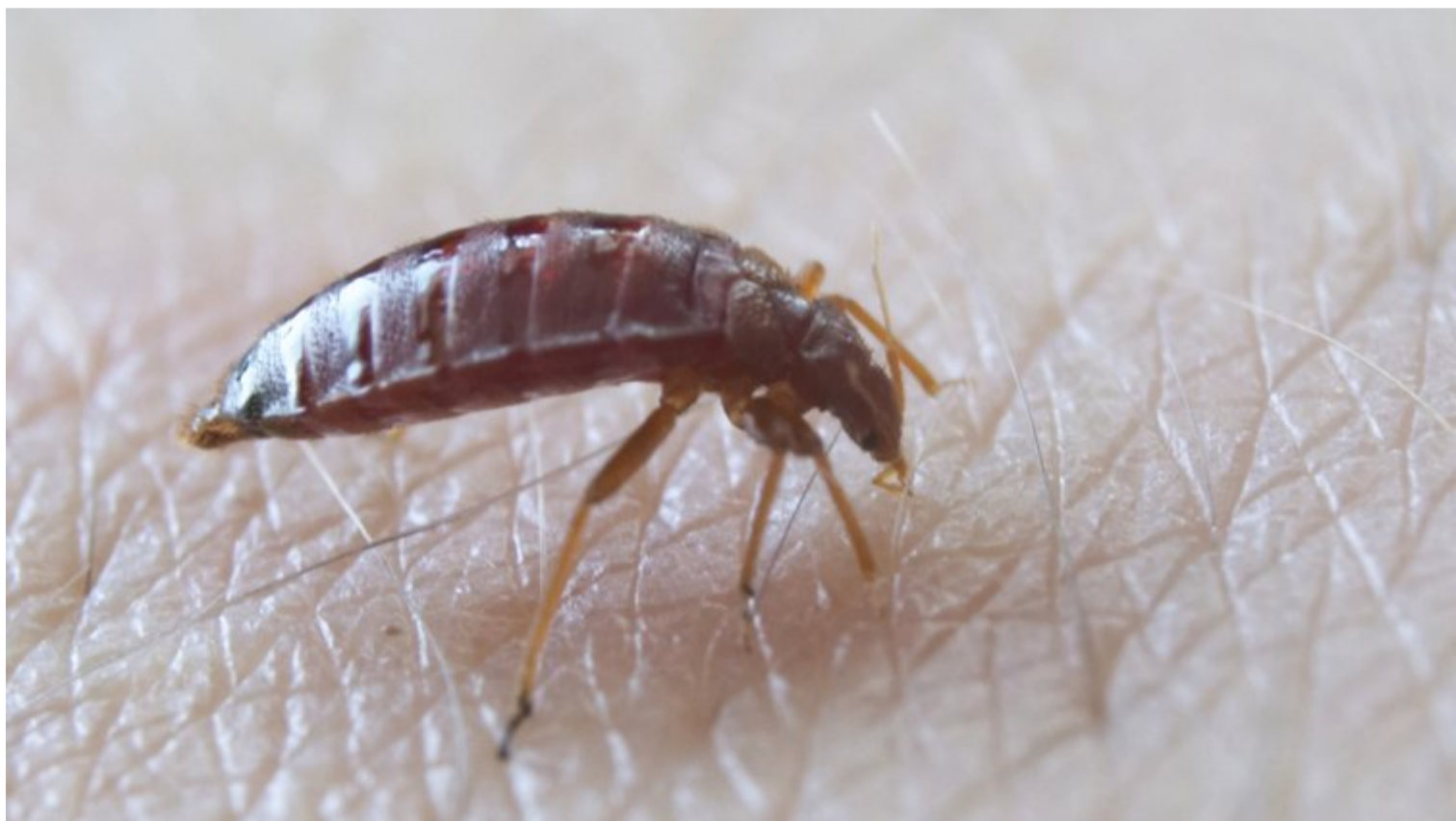
Bid fra væggelus kan forårsage kraftig svie og kløe hos mennesker.